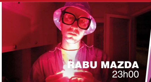
RABU MAZDA 23h00