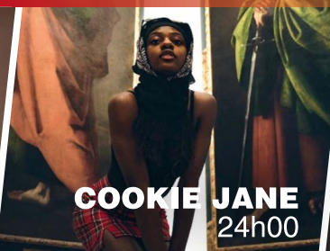
COOKIE JANE 24h00