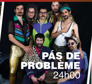
PÁS DE PROBLEME 24h00