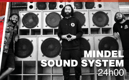
MINDEL SOUND SYSTEM 24h00