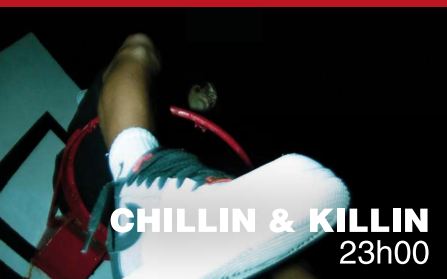
CHILLIN & KILLIN 23h00