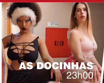
AS DOCINHAS 23h00