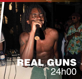
REAL GUNS 24h00