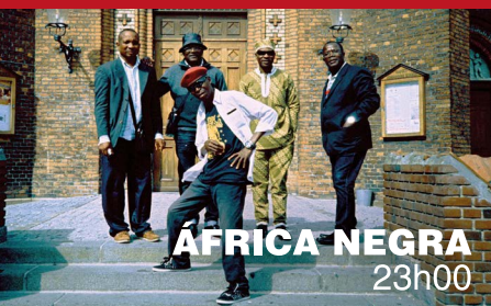
ÁFRICA NEGRA 23h00