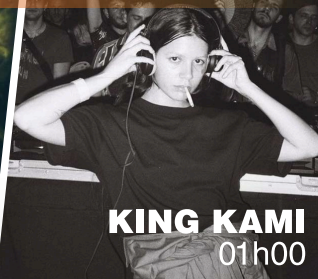
KING KAMI 01h00