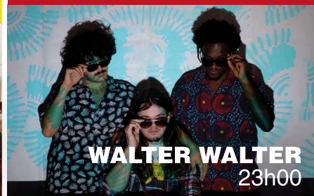
WALTER WALTER 23h00