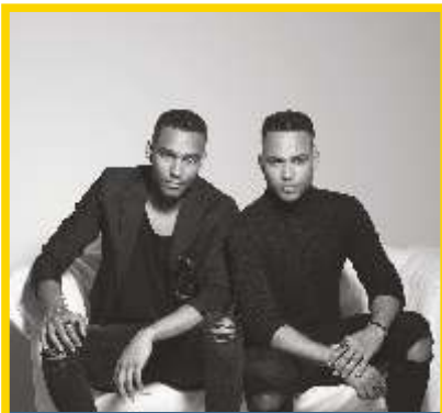
9 AGOSTO CALEMA