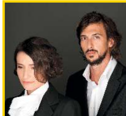
14 AGOSTO DEIXEM O PIMBA EM PAZ