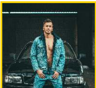
18 AGOSTO DAVID CARREIRA