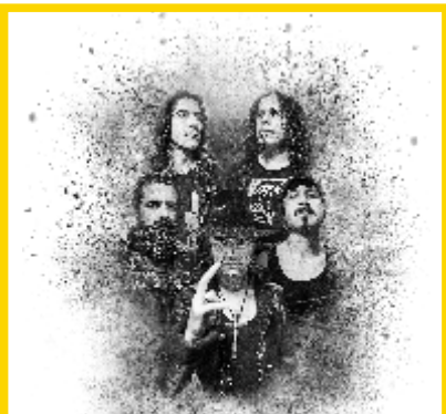
12 AGOSTO MOONSPELL