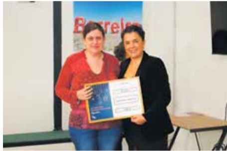
2º prémio | Farmácia Candeias