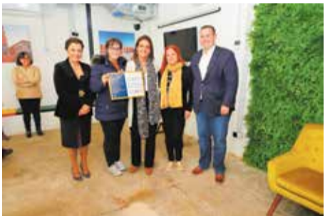
Menção Honrosa Montra mais votada online | Belinha Cabeleiros