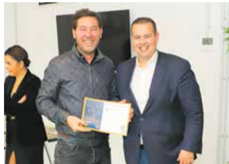
Menção Honrosa Montra Mais Sustentável Ótica Milheiro