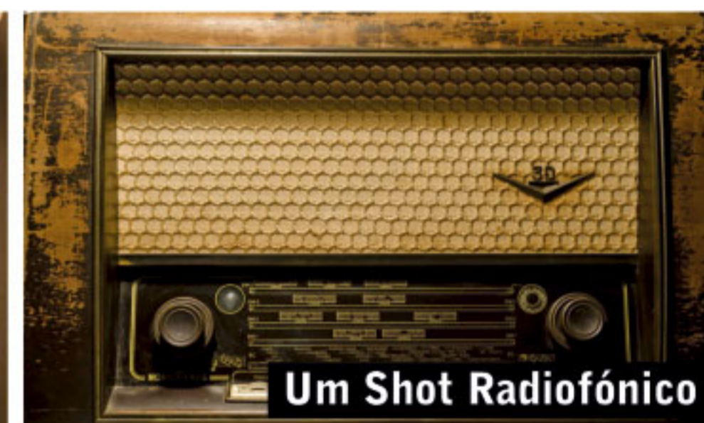
Um Shot Radiofónico