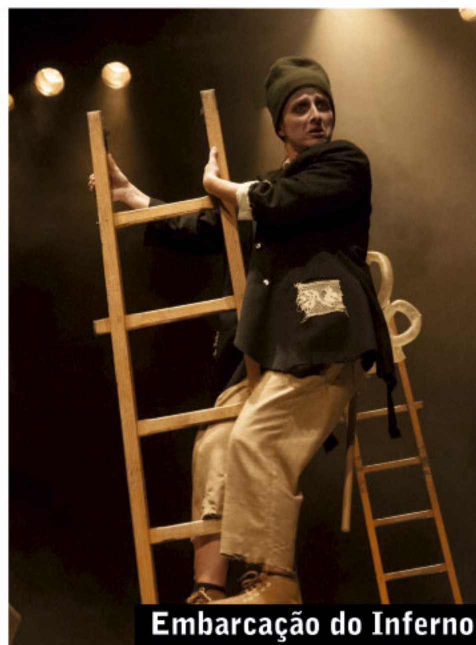
Embarcação do Inferno

Comemoração dos 500 anos da primeira apresentação do "Auto da Barca do Inferno", de Gil Vicente