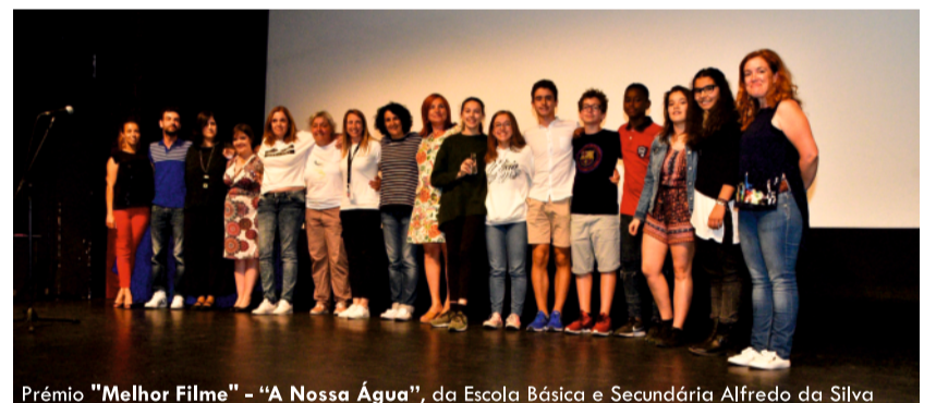
Prémio “Melhor Filme” - “A Nossa Água”, da Escola Básica e Secundária Alfredo da Silva

Na ocasião, todas as equipas participantes receberam certificados de participação.