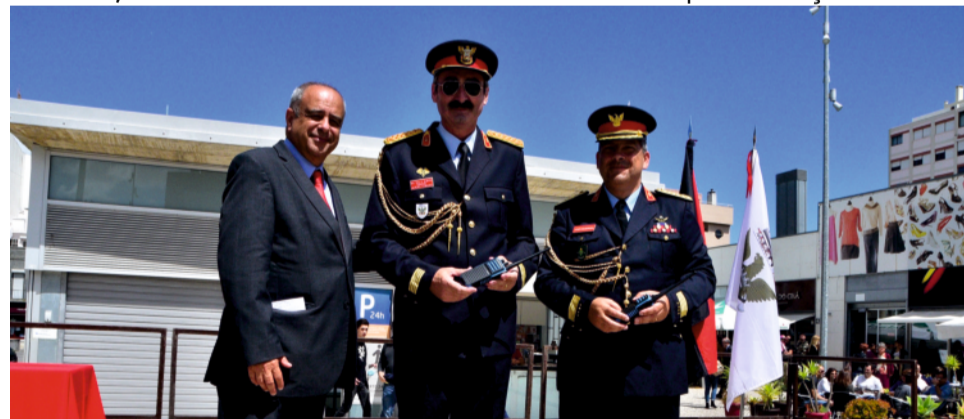
Presidente da CMB entregou, simbolicamente, aos dois comandantes dois rádios de comunicações próprias, para funcionar em atmosferas explosivas

As comemorações terminaram com um almoço convívio das duas corporações de bombeiros, no Quartel de Bombeiros Voluntários do Barreiro – Corpo de Salvação Pública.