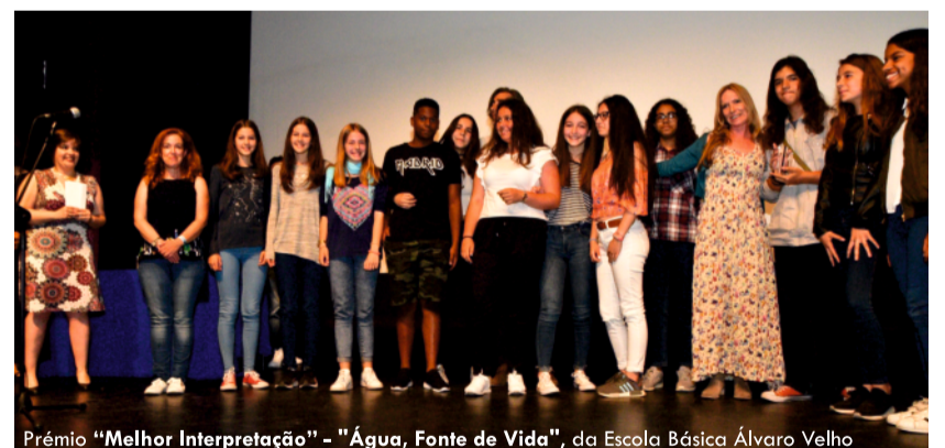
Prémio “Melhor Interpretação” - “Água, Fonte de Vida”, da Escola Básica Álvaro Velho