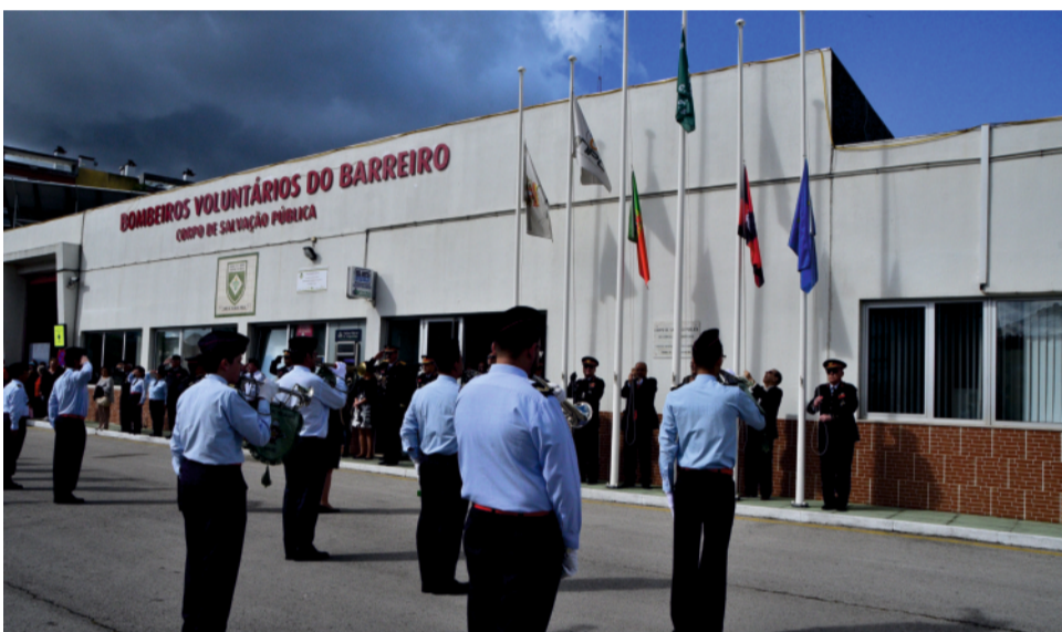
O Dia Municipal do Bombeiro iniciou com o hastear de bandeiras nos quartéis das duas Corporações

No Dia Municipal do Bombeiro, a 6 de maio, o Município homenageou os «Soldados da Paz». A cerimónia de atribuição de condecorações, realizada no largo do Mercado 1º de Maio, foi o ponto alto das comemorações. Seguiu-se o desfile de viaturas dos Bombeiros Voluntários do Barreiro – Corpo de Salvação Pública e dos Bombeiros Voluntários do Sul e Sueste, pelo centro da cidade.