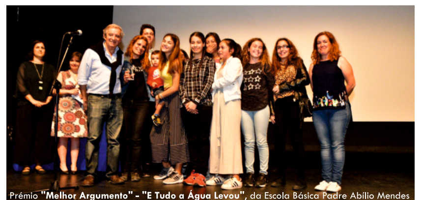
Prémio “Melhor Argumento” - “E Tudo a Água Levou”, da Escola Básica Padre Abílio Mendes