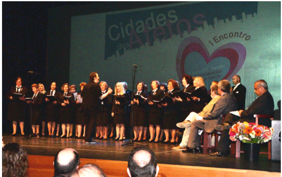
O Coro da UTIB terminou o evento com a interpretação do Hino das Cidades dos Afetos. A letra é de Mário Durval e música de Paulo Cavaco