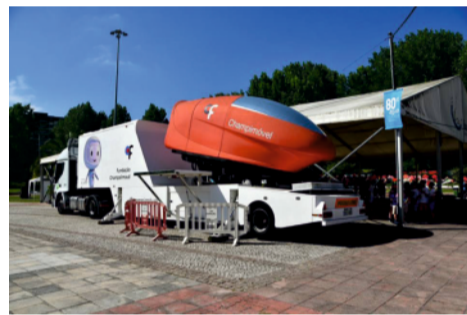
O simulador “Champimóvel” proporcionou uma viagem tridimensional ao corpo humano