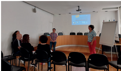
Fig. 1. Ação de Formação interna “Comunicar para a Igualdade: tarefa (im)possível” 15 maio 2023