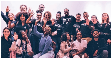
Fig. 2. Encontro de jovens com o artista Dino D'Santiago 1 outubro 2022