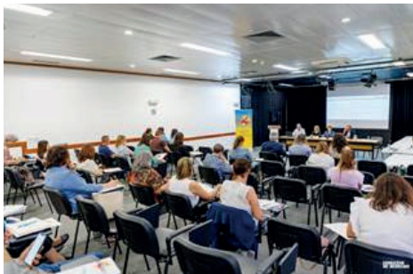
Fig. 2. Apresentação do PMIND do Barreiro, na 55ª Reunião Plenária do CLASB 17 maio 2023