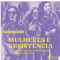
Fig. 6. Exposição documental: Mulheres e Resistência, na Biblioteca Municipal Bento de Jesus Caraça, a partir da exposição temporária "Mulheres e Resistência – Novas Cartas Portuguesas e outras lutas" Março 2023