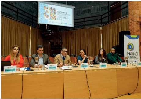
Fig. 5. III Encontro de Partilha e Reflexão sobre a Deficiência "Sexualidade, Afetos e Sentimentos" 31 março 2023