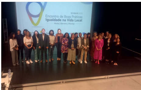
Fig. 3. Participantes Encontro Boas Práticas – Igualdade na Vida Local 10 maio 2023