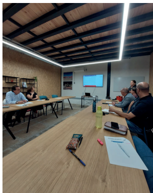
Fig. 3. Ação de Formação interna “Comunicação Inclusiva: a linguagem como paradigma das (des)igualdades” 24 maio 2023