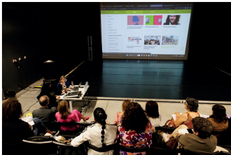
Fig. 1. Apresentação Planos Municipais para a Igualdade 10 maio 2023