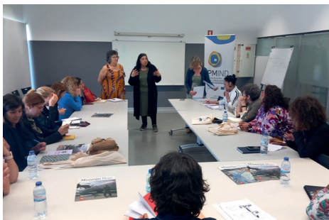
Fig. 2. Reflexão conjunta sobre boas práticas 10 maio 2023