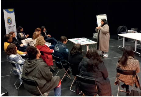
Fig. 4. Reunião de Trabalho – construção de fluxogramas de resposta à MGF 5 fevereiro 2023