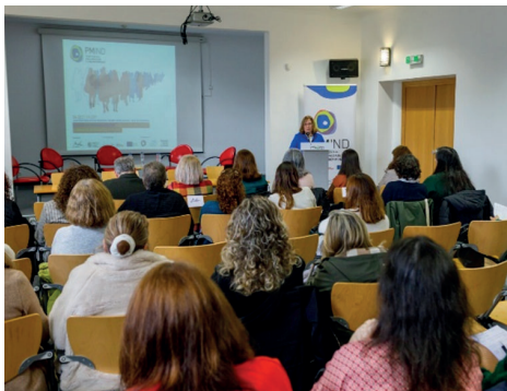
Fig. 3. Sessão de Sensibilização "Acesso de Mulheres e Homens Migrantes à Saúde" 14 dezembro 2022