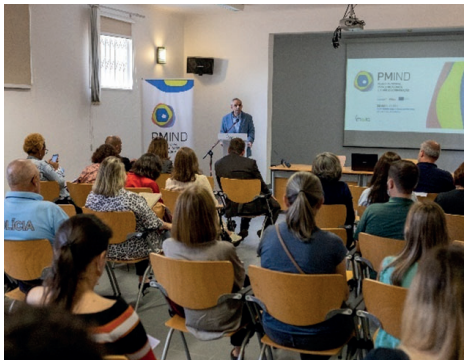
Fig. 1. Apresentação pública do PMIND 25 maio 2022