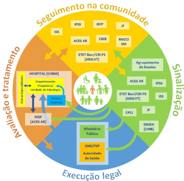
Figura 1. Fluxograma de referência em Saúde Mental

Legenda: ACES AR – Agrupamento de Centros de Saúde do Arco Ribeirinho; ARSLVT – Administração Regional de Saúde de Lisboa e Vale do Tejo; CHBM – Centro Hospitalar Barreiro Montijo; CMB – Câmara Municipal do Barreiro; CPCJ – Comissão de Proteção de Crianças e Jovens em Risco; DISISH - Divisão de Intervenção Social, Igualdade, Saúde e Habitação; ETET Barr/CRI PS – Equipa de Tratamento do Barreiro do Centro de Respostas Integradas da Península de Setúbal; GNR - Guarda Nacional Republicana; IEFP - Instituto do Emprego e Formação Profissional, I. P.; IPSS – Instituição Particular de Solidariedade Social; JF – Junta de Freguesia; MGF – Medicina Geral e Familiar; PSP - Polícia de Segurança Pública; ISS – Instituto da Segurança Social; RNCCI SM – Rede Nacional de Cuidados Continuados Integrados em Saúde mental.