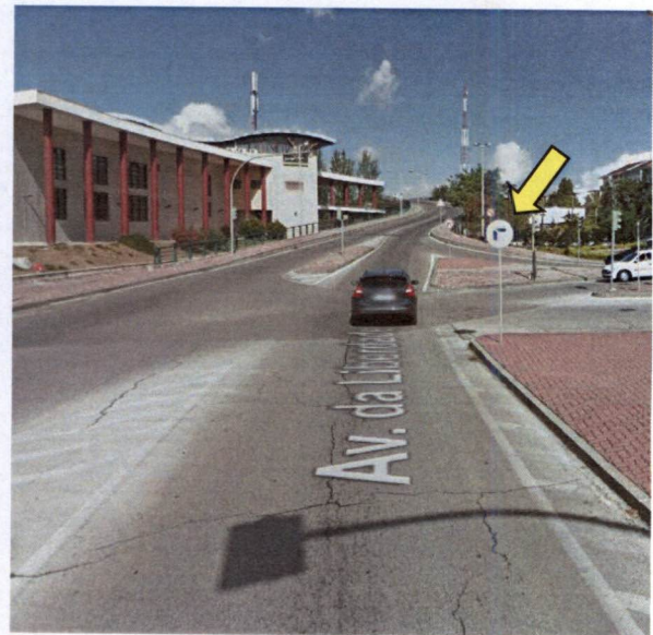
Local de intervenção: Avenida da Liberdade

A intervenção na presente artéria está previsto iniciar-se a 26/02/2019 e com término previsto a 26/02/2019.