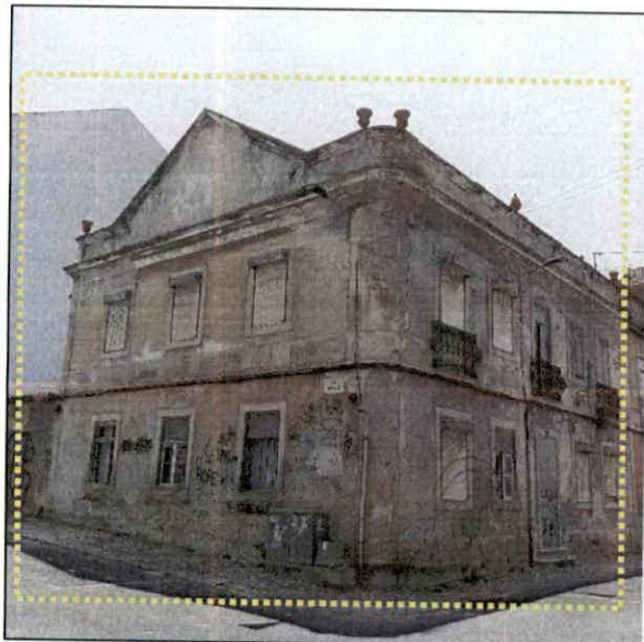
Foto 1 – Edifício a demolir sito na Rua Almirante Reis, 64 / Rua Dr. Eusébio Leão, 2, Barreiro, UFBL