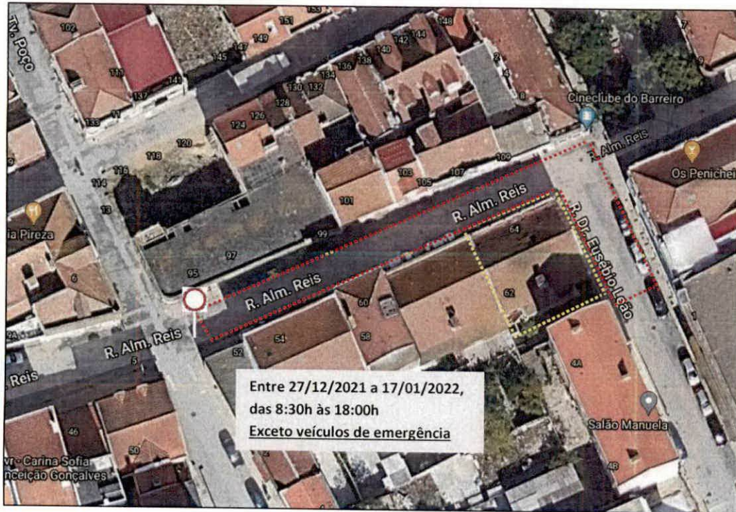
Imagem 1 – Local de intervenção, Rua Almirante Reis, 64 / Rua Dr. Eusébio Leão, 2, Barreiro, UFBL