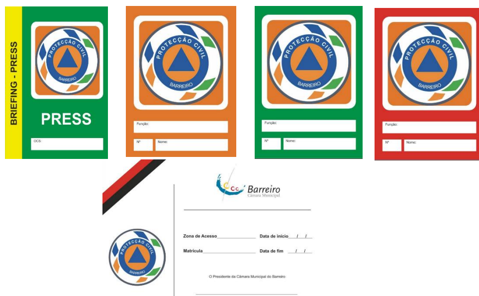
Figura 4 – Cartão de segurança

Para acesso aa áreas de intervenção, será distribuído junto das diversas entidades intervenientes um Cartão de Segurança para a área a ser acedida, que será aposto em local bem visível e disponibilizado sempre que for solicitado. O cartão de Segurança inclui o símbolo gráfico do SMPC, espaço quadrangular colorido respeitante à área de acesso, número sequencial com o nome (primeiro e último) e indicação do Serviço/Entidade que representa.