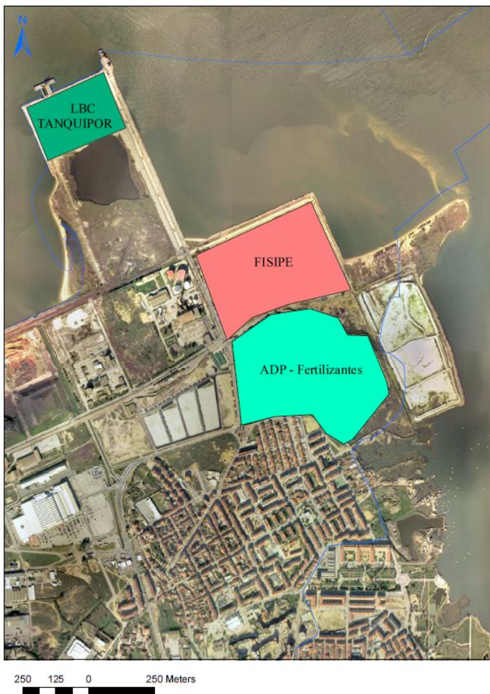
Figura 1 – Cartografia do Município