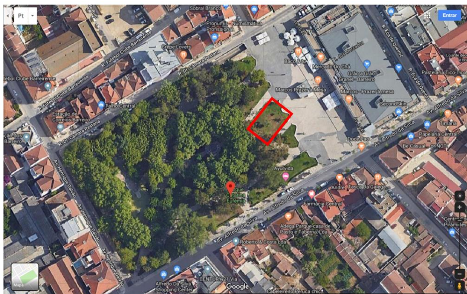
Figura 3 Localização da área de eventos do parque Catarina Eufémia