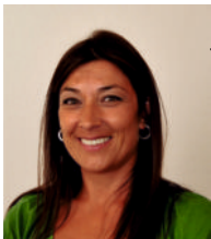
Regina Janeiro Vereadora | CDU

Áreas e Funções: Divisão de Intervenção no Espaço Público e Equipamentos Municipais; Departamento de Águas e Resíduos; Gabinete de Descentralização. Atendimento: 5ª feira de manhã, com marcação prévia, através do número de telefone 21 206 82 76 / 21 206 82 77