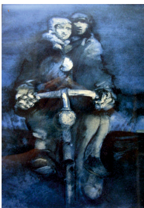
“Acervo” – Rogério Ribeiro, ilustração para o romance de Manuel Tiago “Até amanhã Camaradas”