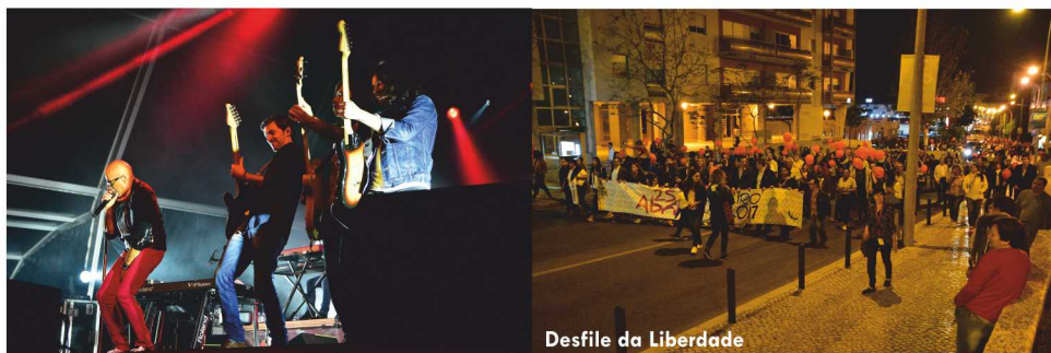
Desfile da Liberdade

Durante a manhã, decorreram os Hasteares de Bandeiras nas oito freguesias do Concelho do Barreiro.