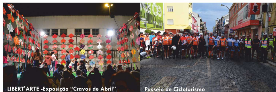
LIBERT'ARTE -Exposição “Cravos de Abril”